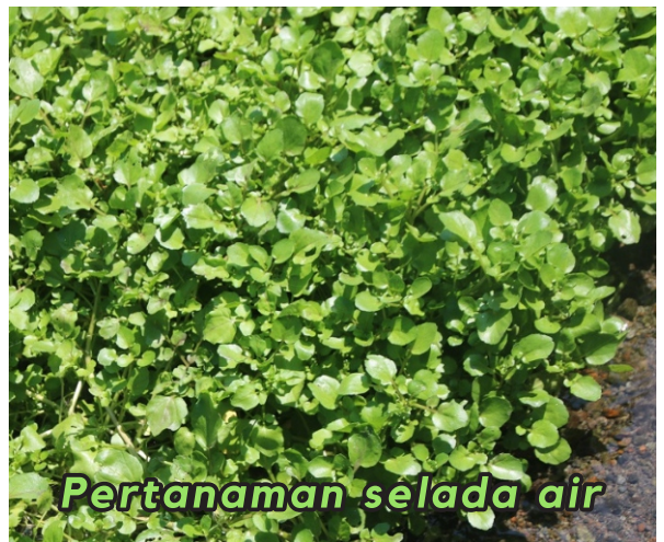
Pertanaman selada air

Meskipun termasuk tanaman air, menurut petani pembudidaya selada air, hasil selada air akan lebih bagus pada musim kemarau. Mengingat kondisi pertanaman selada air di kawasan ini merupakan air yang mengalir, pada musim hujan banyak tanaman yang hanyut.