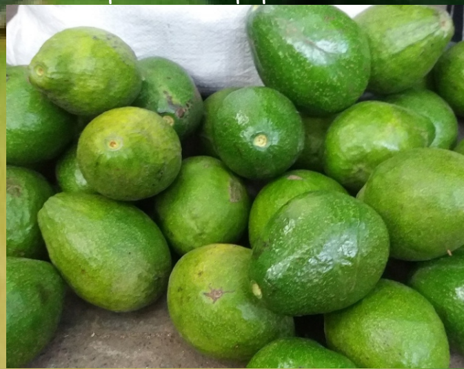
Alpukat siap dipasarkan