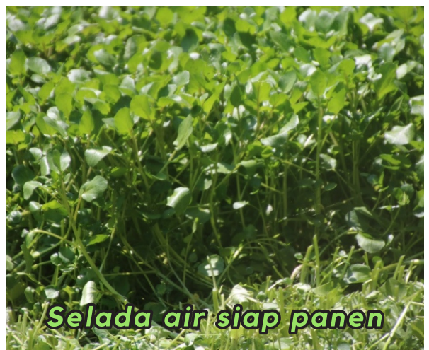
Selada air siap panen