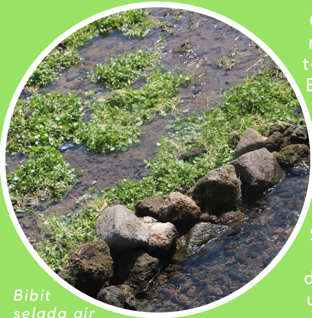
Bibit selada air

Gemerik air akan terdengar saat kita memasuki Kawasan Wisata Tlatar yang terletak di Desa Kebonbimo, Kecamatan Boyolali. Tak hanya tersohor akan mata air, kolam renang, maupun tempat pemancingan ikan dengan air yang jernih, rupanya ketersediaan air yang melimpah di kawasan ini merupakan habitat yang sesuai untuk budidaya selada air, atau biasa disebut cenil. Selada air menyediakan banyak nutrisi dan manfaat kesehatan, dan bisa digunakan dalam salad, sup, roti isi dan untuk memberi rasa pedas yang segar.