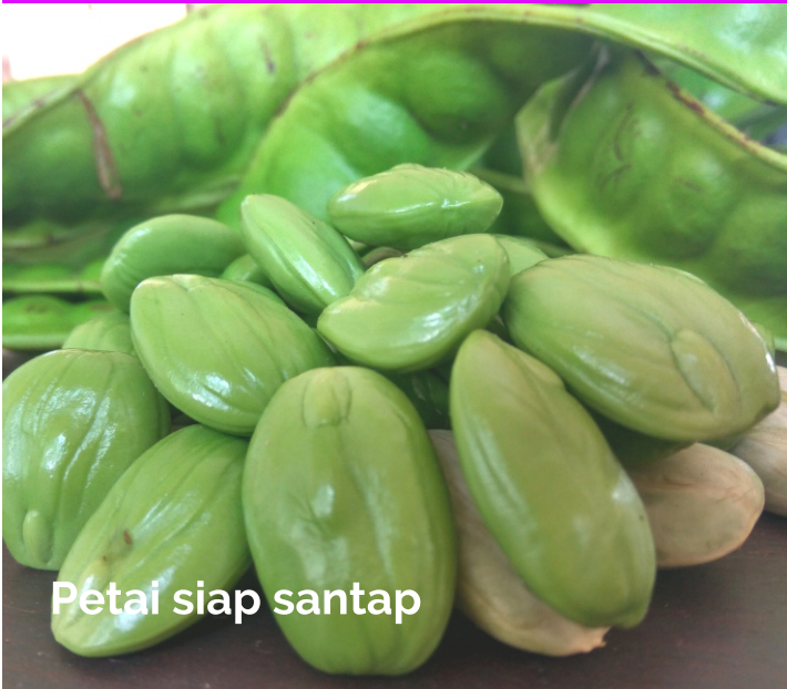
Petai siap santap