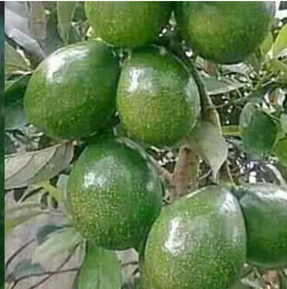
Alpukat siap panen

Memasuki bulan Desember hingga Februari, alpukat mengalami panen raya. Pada tahun. Petani biasa menjual alpukat dalam bentuk tebasan sesuai dengan kuantitas buah per pohon. Dalam sekali tebas, satu pohon alpukat dapat dihargai hingga Rp.2.000.000,-. Selain ditebas, alpukat hasil produksi petani umumnya dijual ke pasar tradisional setempat dan ke Pasar Sunggingan yang berada di pusat Kabupaten Boyolali dengan harga Rp.15.000,-/kg.