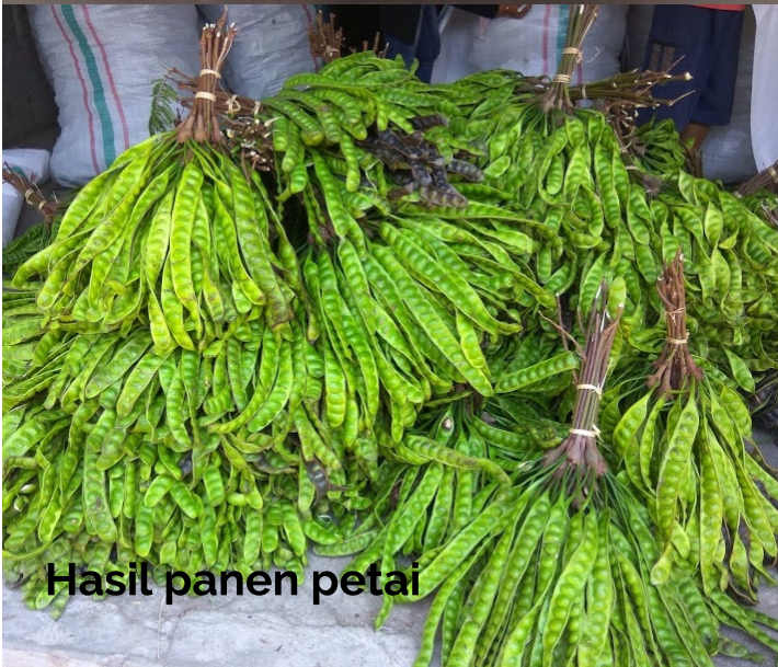
Hasil panen petai