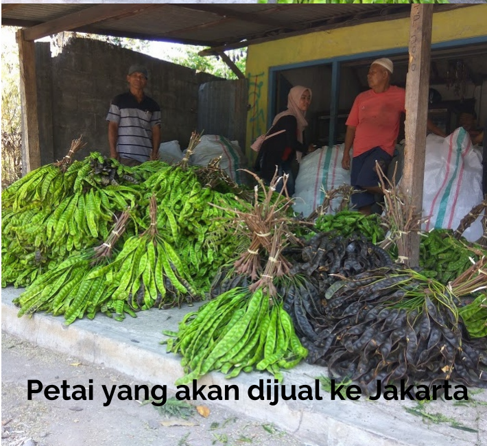
Petai yang akan dijual ke Jakarta

Menyantap petai mentah atau petai goreng bersama sambal ditemani tempe goreng dan nasi hangat yang mengepul rasanya dapat menggugah selera makan. Sayuran yang satu ini memang memiliki citarasa yang unik dengan bau khas seperti jengkol.