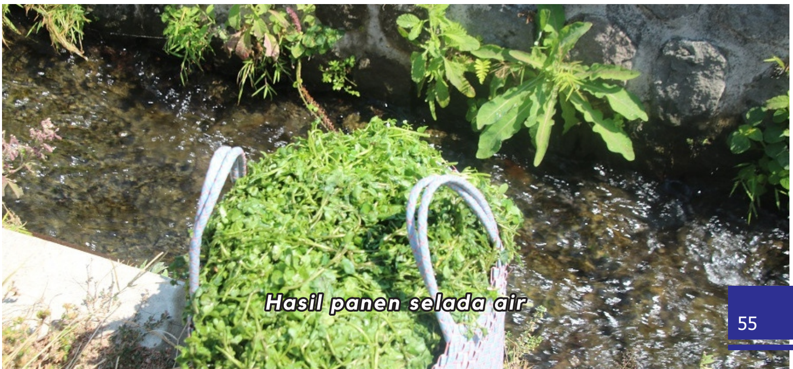
Hasil panen selada air