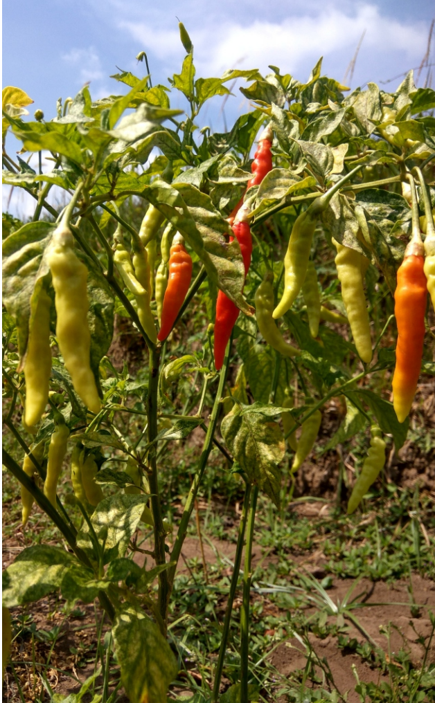
Pertanaman cabe rawit Desa Kebonbimo