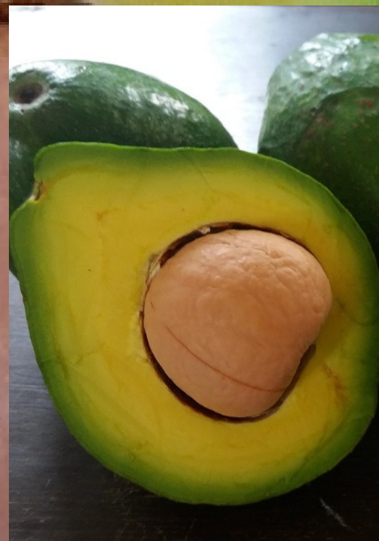
Alpukat siap santap