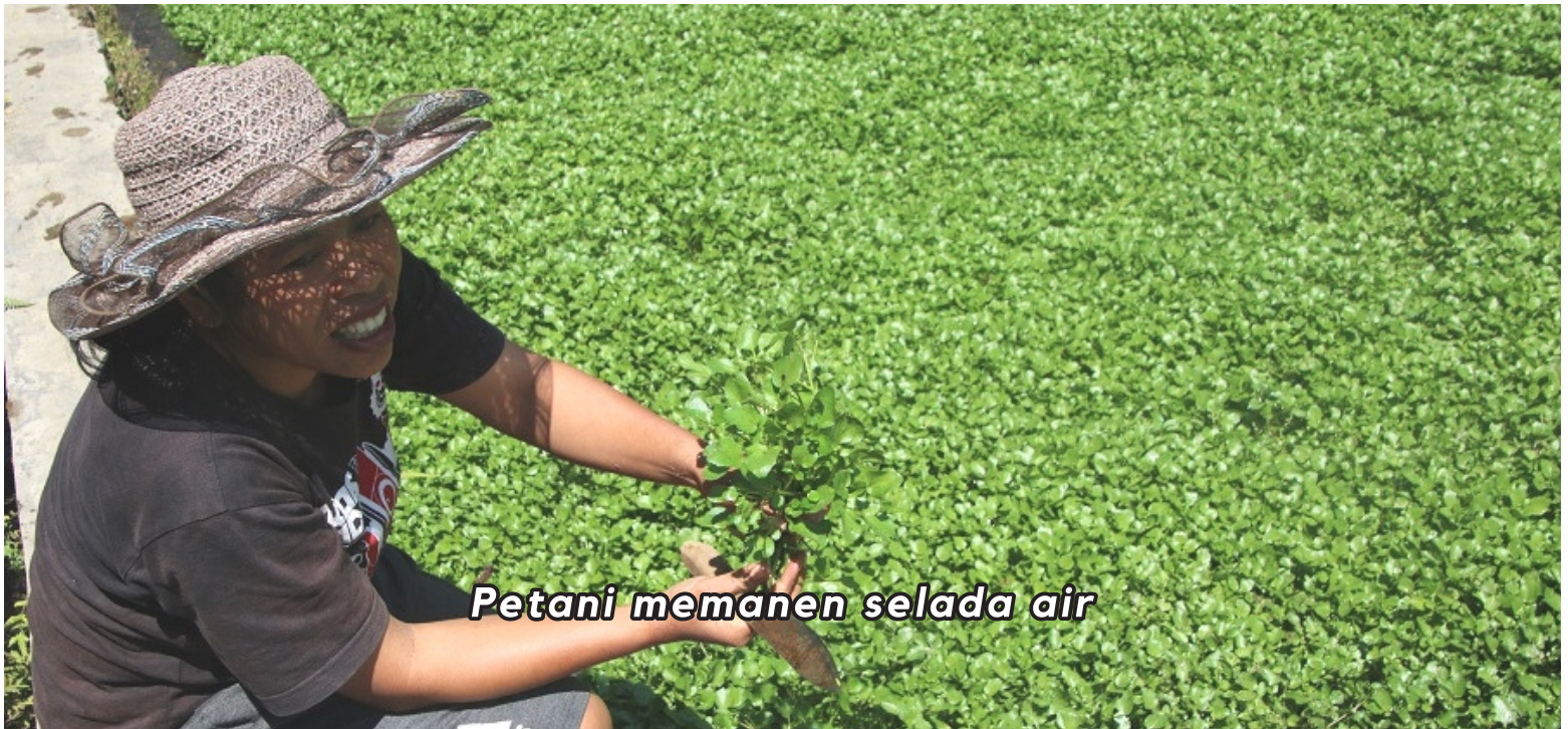
Petani memanen selada air